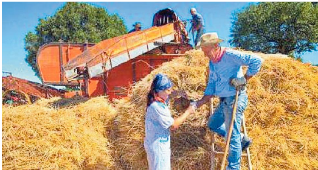
La rievocazione della trebbiatura di una volta, è una delle immagini di Cremascoli