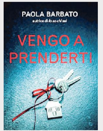
Vengo a prenderti di Paola Barbato Piemme. Pagine 464, 18,50 €

Un agente che insegue lo stalker di una donna si ritrova in un capannone in cui ci sono undici carrozzoni da circo che imprigionano ciascuno un essere umano e lo psicopatico autore di tutto è lì davanti. Un colpo di pistola sembra risolvere la questione, ma tra le vittime si nasconde un complice, che dall'ambulanza riesce a scappare. Inizia una caccia all'uomo, mentre i sopravvissuti iniziano a morire.