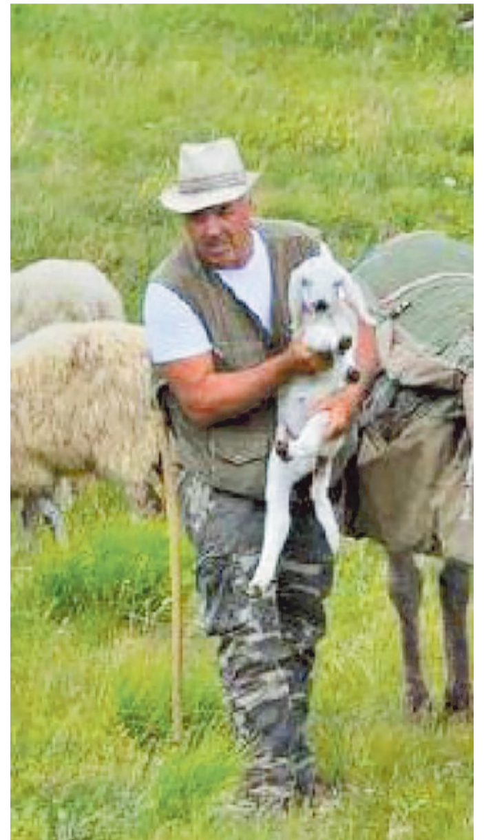
La pastorizia, storica attività dell'uomo nella nostra montagna

Paesaggi colori persone di Luciano Cremascoli Bandeddici & Vivaldi